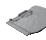
90 TL Rive entière droite 5 au ml - 2,75 kg