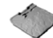
893 TL Rive trois-quarts gauche 5 au ml - 2,8 kg