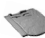
894 TL Rive trois-quarts droite 5 au ml - 2,8 kg