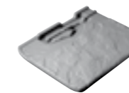
89 TL Rive entière gauche 5 au ml - 3,75 kg