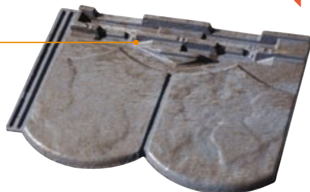
Coloris : ton cévenol

Avec la Tuilauze, Terreal propose sur une même palette douze tuiles distinctes à doubles écailles, ce qui permet d'arriver à une variété de vingt-quatre types de reliefs différents. Normalement brassées lors de la pose par le couvreur, les Tuilauze reproduisent ainsi l'irrégularité originale des toits en lauze.