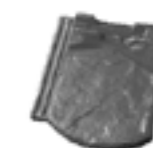
5 TL Demi-tuile - 2,4 kg